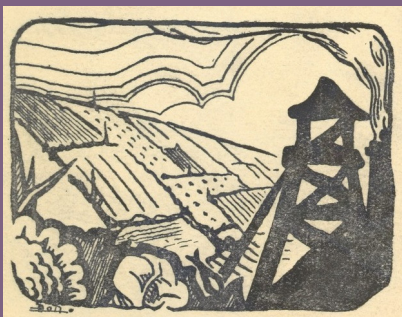
Louis Théolier. L'Homme noir chez les hommes noirs Félix Volpette. Ed. Spes, 1930